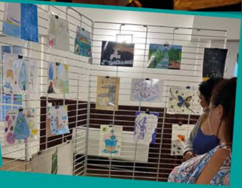
Le concours de dessins du Conseil de l'Eau de la Néra