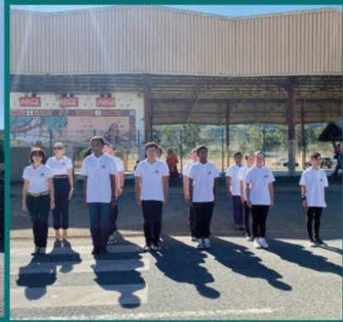
La cérémonie et les festivités du 14 juillet 2023

La première plantation du programme PERENNE porté par le WWF pour lutter contre l'érosion des berges de rivières, à Nessadiou.